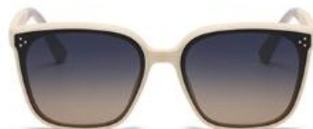
C3 米白框上深灰下茶