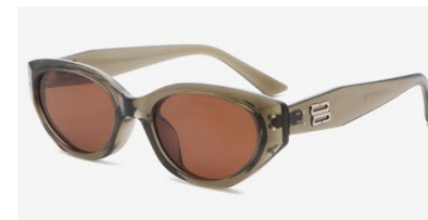
橄榄绿框茶片偏光