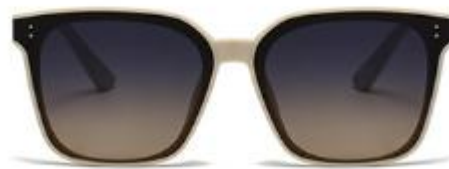
C3 米白框上深灰下茶